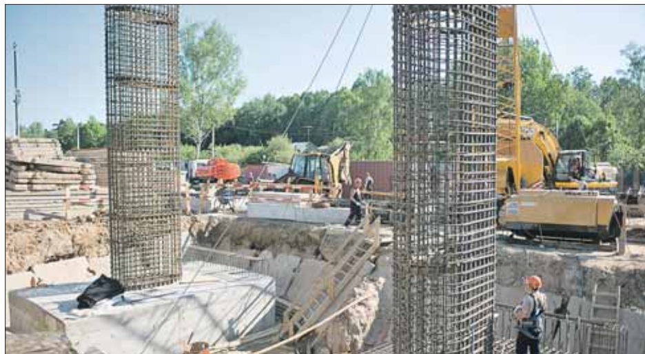
Рабочие строят опоры эстакады

Строительство эстакады началось в феврале этого года. Под ней предусмотрено девять опор. Сейчас возводят три из них, а остальные ставить пока