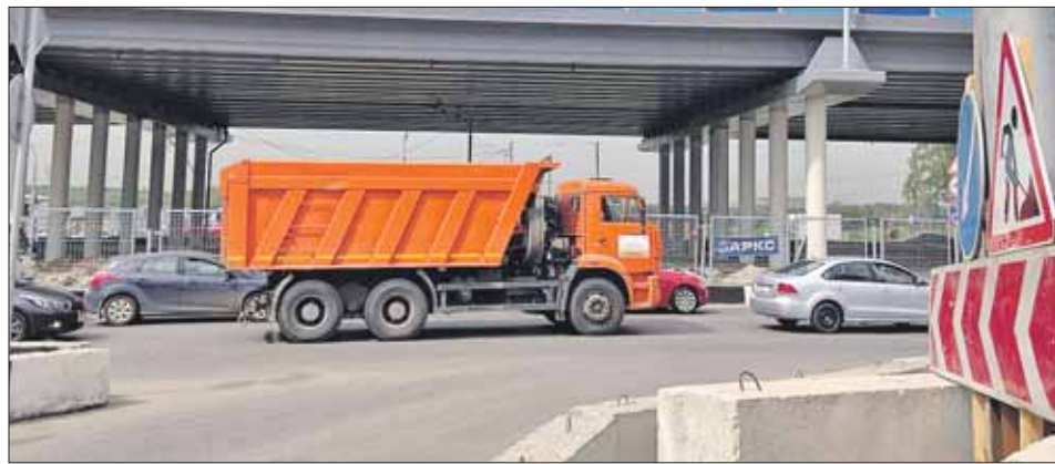
Чтобы установить шумозащитный экран, приходится корректировать проект реконструкции Дмитровки

Када, произведут шумозамеры и, если показания приборов превысят допустимые нормы, рассмотрят вопрос о строительстве такого же шумозащитного экрана напротив 9-го микрорайона и новых домов 4-го микрорайона. Когда утвердили проект реконструкции Дмитровского шоссе, то ещё не были построены новые микрорайоны Северного, поэтому и в планах никакого шумозащитного экрана не предусматривалось. Теперь же приходится корректировать план реконструкции Дмитровки.