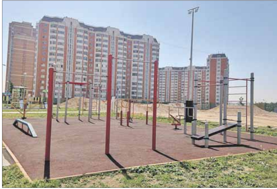
Отвечать за работу подрядчиков будут и директора школ

— В 2013 году некоторые директора закрывали глаза на нерадивое отношение подрядчиков к работе. Такого мы больше не допустим. Если контроль по