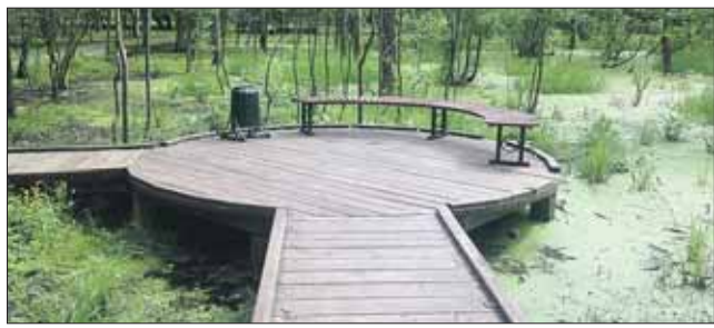
Пока в парке отсутствует система дренажа

Три года назад, во время сооружения парка в 9-м микрорайоне, на небольшом заболоченном участке было решено сделать болотный сад. По данным специалистов, здесь сохранился ценный болотный биоресурс: редкие водные растения и насекомые, особый вид лягушек. Чтобы жители могли поближе познакомиться с болотной флорой и фауной, над болотом проложили деревянные мостки,