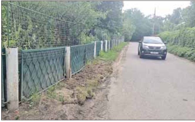
Вопрос обустройства тротуаров рассмотрит Совет депутатов

? Мы ходим в парк по 6-й Северной линии. Мамы с детьми, пожилые люди, школьники вынуждены идти прямо по проезжей части, поскольку тротуаров нет. Машин здесь ездит не очень много, но всё равно чувствуешь себя неудобно.