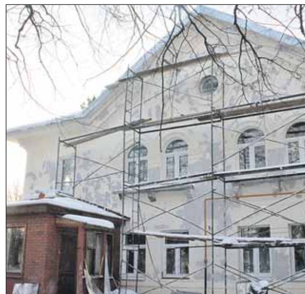
Из этого дома на 3-й Северной линии, 14, украли батареи отопления

Через некоторое время мужчины познакомились в Долгопрудном с водителем «Газели» и рассказали ему о задуманном. Владелец автомобиля согласился помочь. Ночью злоумышленники забрались в коттедж и украли оттуда 18 радиаторов, попутно прихватив ещё и циркулярную пилу. Ночевавший в коттедже бригадир подрядчиков утром почувствовал жуткий холод: двери коттеджа были распахнуты, а батареи исчезли. Обнаружив пропажу, он немедленно обратился в полицию.