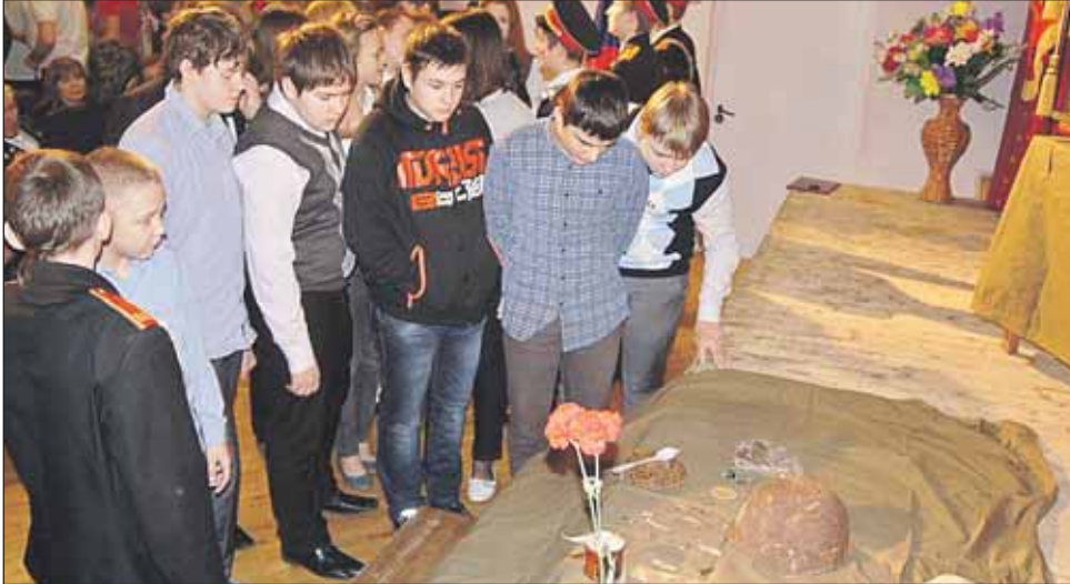
Учащиеся школы №709 рассматривают найденные вещи героя

Эта история началась в сентябре прошлого года под Санкт-Петербургом. Как-то в беседе с одним из бойцов питерского поискового отряда «Шлиссельбург» его знакомая рассказала, что её дача стоит на «Невском пятачке», где в октябре 1941 года шли тяжёлые бои, и прямо в саду то и дело попадаются человеческие останки. Вскоре туда направились поисковики, и под яблоней, совсем неглубоко под землёй обнаружили останки советского офицера, а в нескольких метрах от него — троих солдат. В