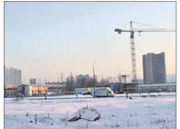
На этой площадке планируется построить продовольственный магазин

? Будут ли строиться в 9-м микрорайоне Северного продуктовые магазины экономкласса?