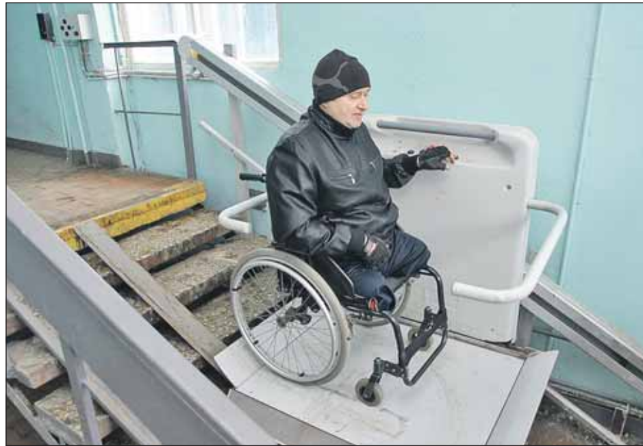
Такие подъёмные платформы установят для передвижения инвалидов-колясочников

— Второе: если мы ставим человеку платформу и хотим, чтобы он ею пользовался, мы должны обеспечить ему возможность передвигаться в рамках дорожной карты, — отметил Виноградов. — Иначе смысла никакого нет: он спустится из квартиры и никуда не поедет. И третье: мы должны задействовать те платформы, которые имеются, но в силу разных