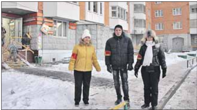
Дружинники Северного патрулируют улицы своего района