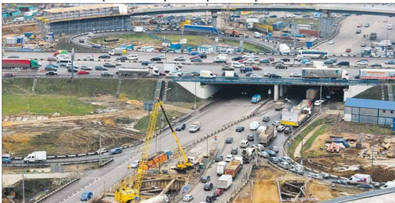
Реконструкция Дмитровского шоссе идёт полным ходом

Общественные инспекторы обсудили с руководством округа решение транспортных проблем