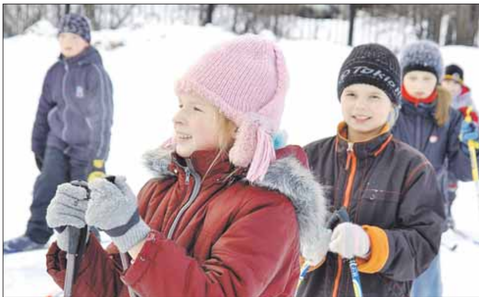
Лыжные гонки очень нравятся школьникам района