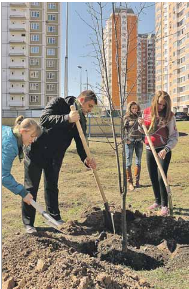
Ребята из детдома №51 высаживают липы на «Алее новорождённых»

26 апреля, как и во всей Москве, в Северном прошёл традиционный субботник. Кроме жителей района, сотрудников управы и муниципалитета, в субботнике приняли участие воспитанники детского дома №51. К полезному делу молодых людей при-