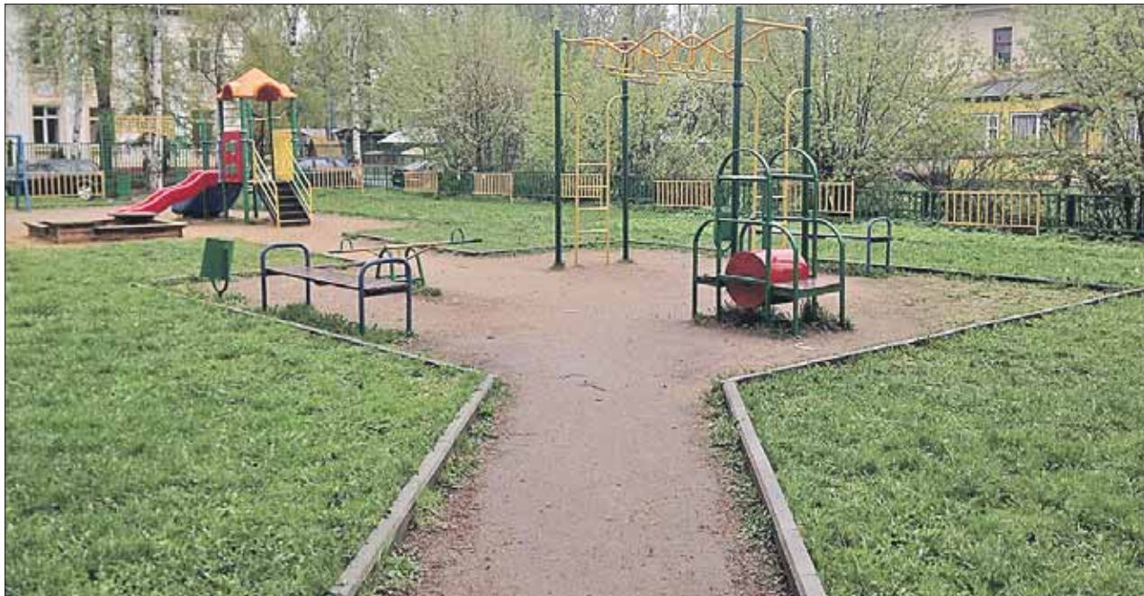
К детской площадке в Старом посёлке проведут освещение